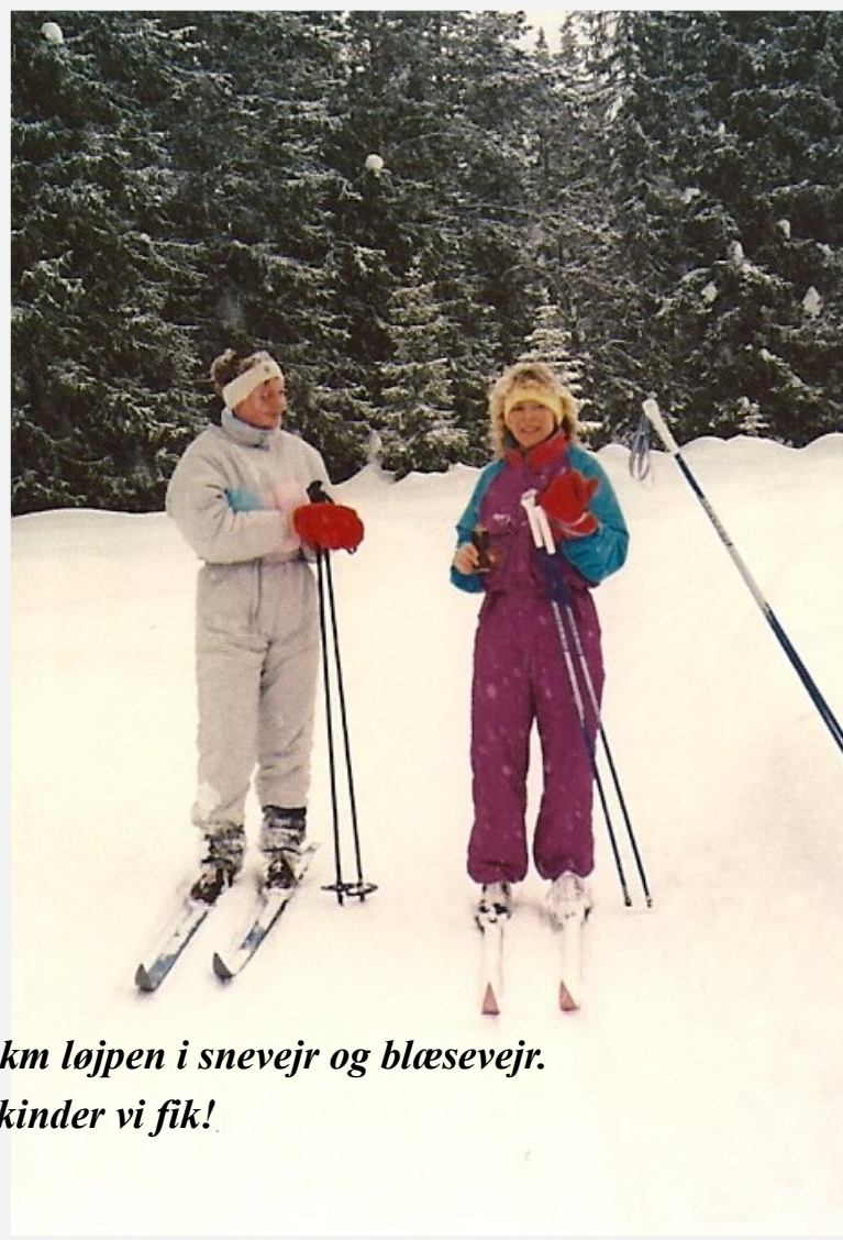
På 12 km løjpen i snevejr og blæsevejr. Sikke kinder vi fik!