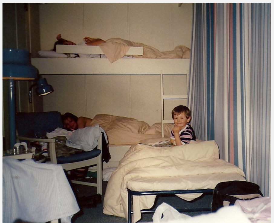
Vi havde et dejligt værelse med god plads til os alle.